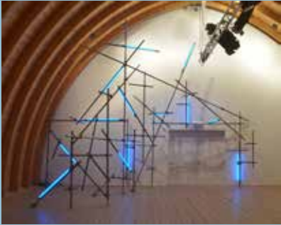
Christoph Dahlhausen, Stabilizing Light Freising , 2017 Installation im Schafhof, Europäisches Künstlerhaus, Freising