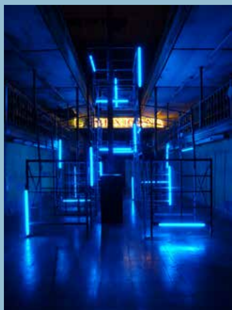
Christoph Dahlhausen, Stabilizing Light , 2013, Installation in La Mexicana, Chihuahua (Mexico); Foto: Christoph Dahlhausen

Kontakt: Kunststiftung Erich Hauser Dr. Heiderose Langer, Geschäftsführerin Saline 36, 78628 Rottweil T +49 (0) 741 2800 18-0 info@erichhauser.de, www.erichhauser.de