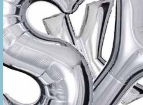
Andreas Schneider, Grafik-Entwürfe für Projekt Silver Sky, 2019