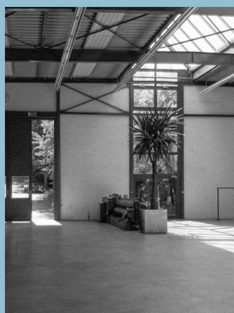
Blick in die Werkstatthalle