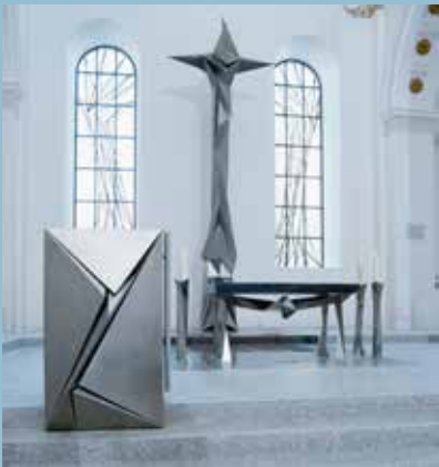
Innenraum, Kirche Sankt Maria in Schramberg

Veranstaltungshinweis: Jubiläum 175 Jahre Kirche Sankt Maria in Schramberg und 25 Jahre Kirchenkunst von Erich Hauser; Veranstaltungen am 19./20.10.2019. Weitere Infos: www.stmaria-hlgeist.de